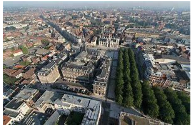
Roubaix vue du ciel