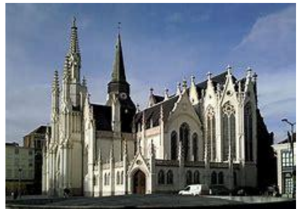
L'église saint Martin