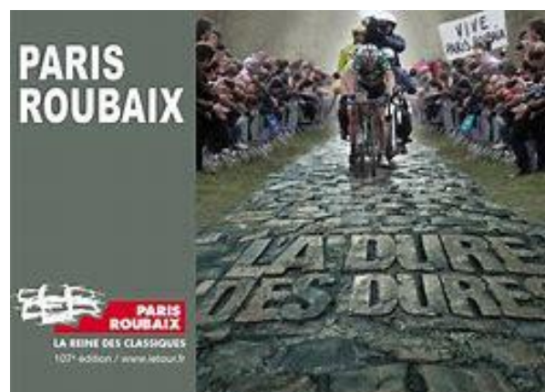
L'enfer du Nord ...