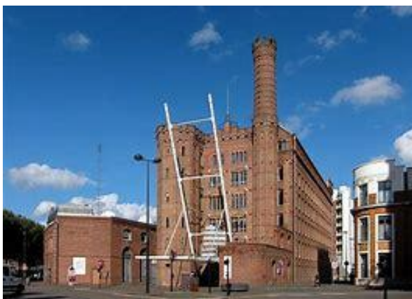
L'usine Motte Bossut