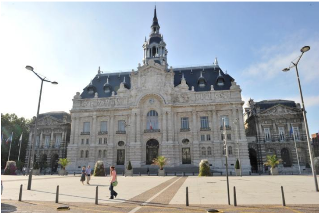
L'hôtel de ville